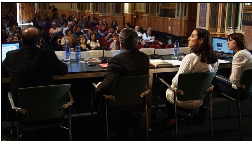
Jornada Municipios, Cooperación y Solidaridad, 15 de mayo 2013.