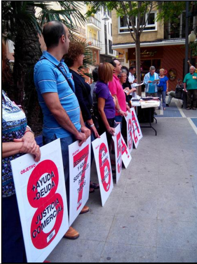
Pobresa Zero, 18 de octubre de 2013. Concentración en Elda.