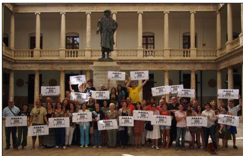
Pobresa Zero 21 de septiembre 2013. Encuentro de Entidades Adheridas.

Para jornada los detalles Campaña definiditos - fechas de las centrales- y despedimos que viene.