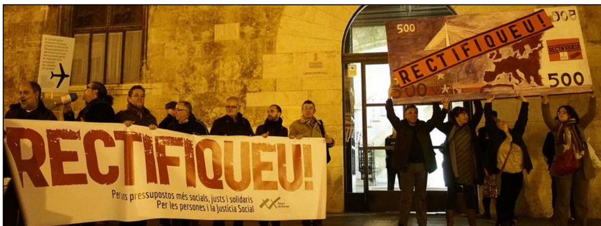
Manifestación RECTIFIQUEU, 17 de diciembre 2013.