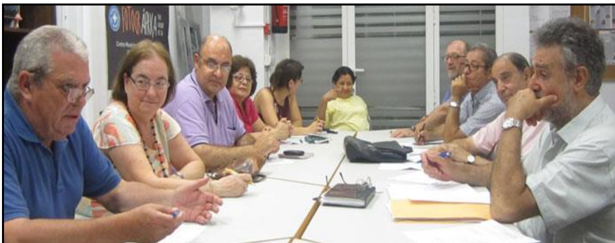
Reunión Unidad Territorial de Alicante, 2013.

Al menos 21 personas de 16 ONGD han participado en alguna de las 10 reuniones celebradas a lo largo del año 2013, si bien en general se ha constatado una reducción de la participación en las propias organizaciones. Las organizaciones que han participado en estas reuniones son: Arquitectos sin Fronteras, Ayuda en Acción, Cáritas Diocesana Orihuela Alicante, Cruz Roja, Entreculturas, Entrepobles, Fundació Pau i Solidaritat, Interred, Intermón Oxfam, Mapayn Mundi, Médicos del Mundo, Medicus Mundi CV Alicante, Proyecto Cultura y Solidaridad, Pueblos Hermanos, Sisma Mujer y Solidaridad Internacional.