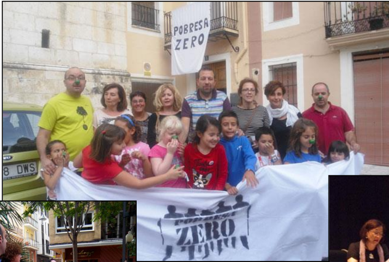
Pobresa Zero, 18 de octubre de 2013. Concentración en Penaguila.