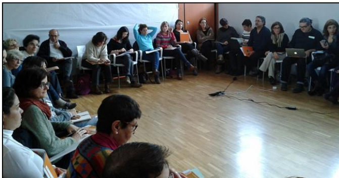
Encuentro de las Coordinadoras Autonómicas, noviembre 2013.

En el XI Encuentro de Coordinadoras Autonómicas de noviembre en Cáceres se ha hablado del modelo de Coordinadora Estatal a futuro y su sostenibilidad, tema previamente abordado en las dos reuniones de presidencias de las Coordinadoras Autonómicas, pero también de las oportunidades que nos brinda al sector el actual contexto socio-político, de las nuevas vías de incidencia política y comunicación, así como de los retos y lecciones ya aprendidas en los últimos años de profundo cambio de políticas de cooperación.