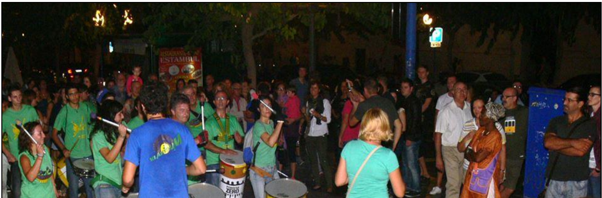
Pobresa Zero, concentración 19 de octubre de 2013.

En Alicante se celebró una concentración en la Pl. San Cristóbal de Alicante el 19 de octubre de 2013 en la que participaron alrededor de 200 personas y organizaciones y en la que actuó el grupo de percusión KLAIBUM, hubo una marcha hasta el Banco de España donde se leyó el manifiesto contra la pobreza.