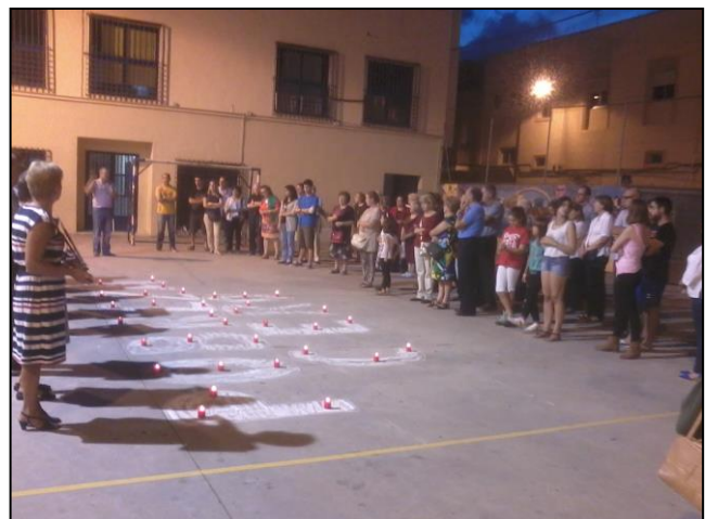
Pobreza Zero, 18 de octubre de 2013. Concentración en Port de Sagunt