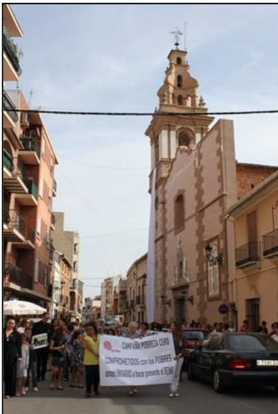
Pobreza Zero, 18 de octubre de 2013. Manifestación en Rafelbunyol

Otras localidades donde se llevaron a cabo las actividades: Alcoleja, Almàssera, Benifallim, Elda, Penáguila, Port de Sagunt, Quart de Poblet, Rafelbunyol, San Andrés de Almoradí, Vila real, Vilallonga.