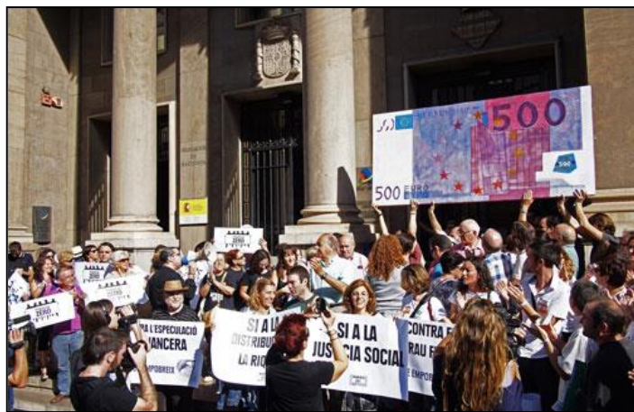
Pobresa Zero, 17 de octubre 2013. Acto reivindicativo delante de la Agencia Tributaria en Valencia.

En Valencia, siguiendo el éxito mediático del año pasado, apostamos por una acción de calle el mismo día 17 de OCTUBRE, dejando la manifestación como remate de la campaña 2013. Así pues se celebraron dos actividades: una a mediodía, frente la Hacienda Autónoma, con un billete gigante de 500 euros de cartón piedra, como