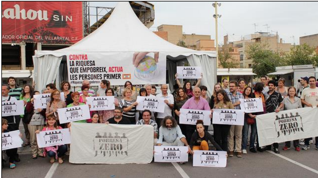
Pobreza Zero, 19 de octubre de 2013. Concentración en Vila Real.

En la concentración de Pobreza Zero del 19 de OCTUBRE celebrada en la Feria de Voluntariado y Solidaridad de Vila Real se han encontrado centenares de personas y muchísimas ONGD. Unas 200 personas se han unido a la lectura del manifiesto y muchas han cantado y bailado al ritmo del RAP DE POBREZA CERO DE PSICOLOKO, DEUDA PENDIENTE (DJ MATA & PSICOLOKO)