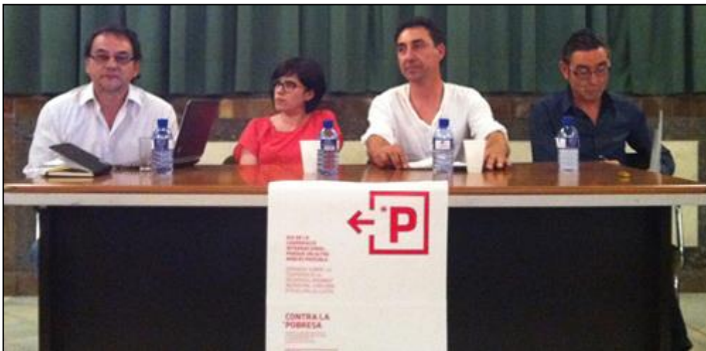
Día de la Cooperación Internacional, Castellón 4 de junio.

Este año hemos optado por no celebrar la feria de ONGD en la Plaza Santa Clara y a cambio organizamos una mesa redonda con participación de 3 municipios de la Provincia de Castellón que siguen apostando por la cooperación al desarrollo: Alcora, Betxí y Vila-real. Los representantes de Morella han declinado la invitación por indisponibilidad de la agenda.