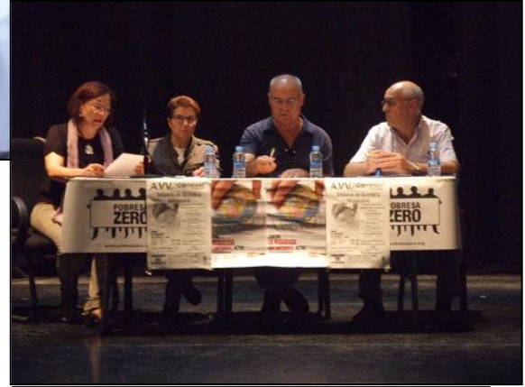
Pobresa Zero, 18 de octubre de 2013. Charla de Pobresa Zero en Almáspera.