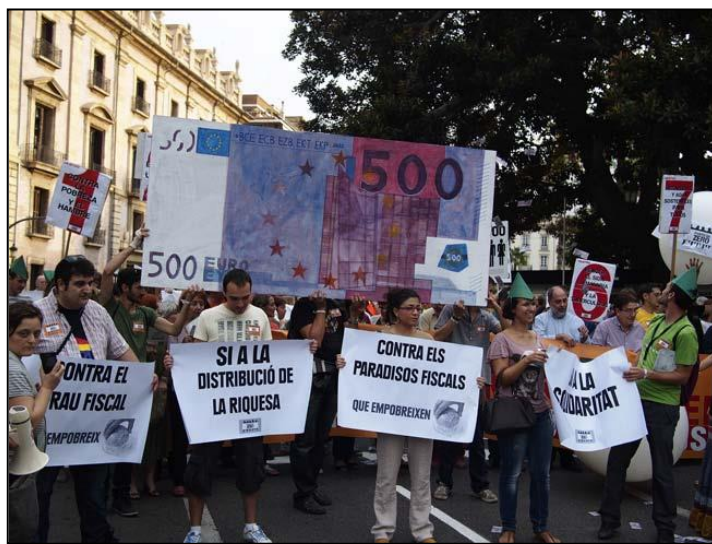
Pobresa Zero, 19 de octubre de 2013. Manifestación en Valencia.

La manifestación ha contado con el apoyo de las organizaciones de la Cimera Social, de la Xarxa de Xarxes de Acció Social y Cooperación, de la Alianza por la Defensa de los Servicios Públicos, de Totes Junes y de varias asambleas del 15M entre otros movimientos sociales.