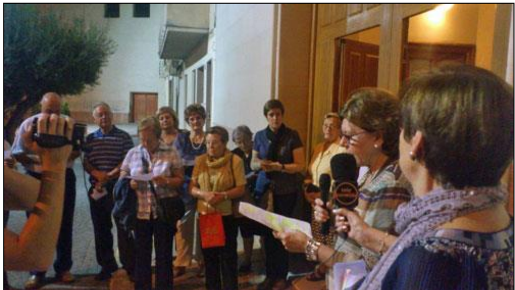
Pobresa Zero, 18 de octubre de 2013. Concentración en Novelda.