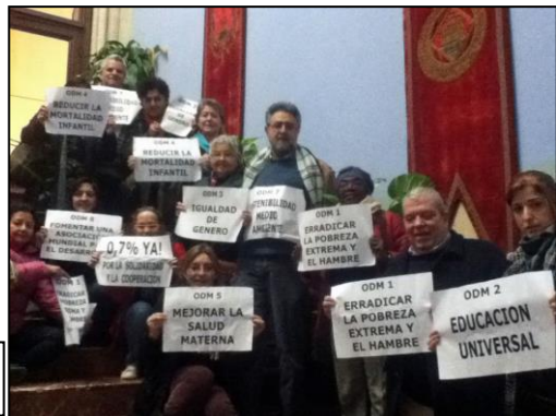
Acto reivindicativo delante del Ayuntamiento de Alicante, 30 de enero 2013.