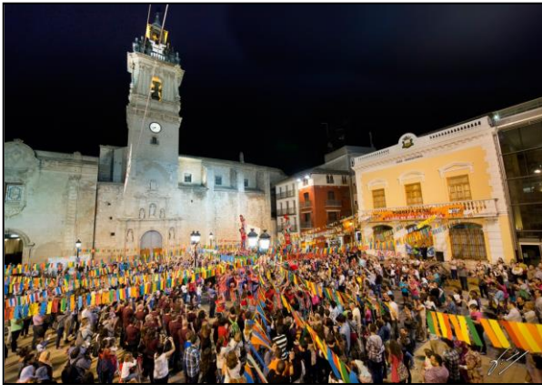
Pobresa Zero 25 de octubre de 2013. Concentración en Algemés.

En Algemés, gracias a la implicación y movilización de muchos colectivos se ha conseguido llegar a un grupo de gente muy importante. En la concentración en la Plaça Major del día 25 de octubre han participado más de 3.500 personas, y en diferentes actos organizados durante la semana y el sábado 26 en “Mou-te per la pobresa” más de 1.500 personas.