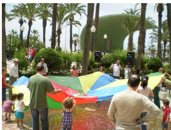
XIII Xarxa Solidaria, Alicante, 31 de mayo 2009.