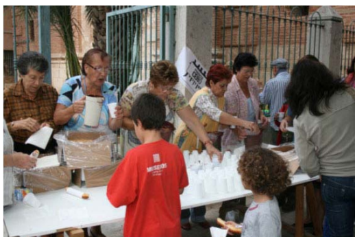
Concentración con Xocolatà en la localidad de Almàssera. Semana contra la pobreza 2009.

En la comarca de la Safor, al igual que el año pasado, se celebraron diversos actos como un video forum o las paraetas solidarias, destacando la Manifestación en la localidad de Oliva con 300 personas.