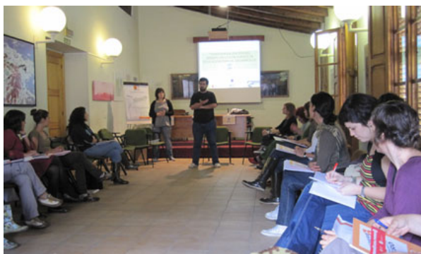
Formación Interna- Transversalización de género en la educación para le desarrollo en Valencia. 29 y 30 de septiembre de 2009.