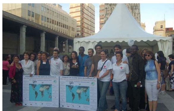
Día de la Cooperación Internacional, Castelló, 30 de mayo 2009. CVONGD.

Durante todo el día y de manera simultánea con las demás actividades, los voluntarios y voluntarias de Cruz Roja y Educació Sense Fronteres , acompañados de Emeno es Vida , contaron cuentos y llevaron a cabo una serie de talleres con los niños y niñas que acudieron al acto. A su vez nuestros colaboradores de Amics de Palanques estaban entregando al público infantil las semillas de cedro, una contribución al 7º Objetivo del Milenio sobre la sostenibilidad medioambiental. El día culminó con el espectáculo de danza del vientre ofrecido por la Escuela de Danza «IVANA» y la música del grupo Melodía Viva .