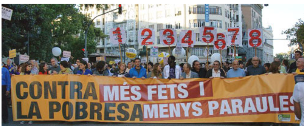
10.000 personas participaron en el acto central de la Semana contra la Pobreza 2009: la Manifestación en Valencia el 17 de octubre.

En este año más de 30.000 personas en toda la Comunitat bajo el lema “Contra la pobreza más hechos y menos palabras” participaron en los actos organizados de la Semana contra la Pobreza. Se organizaron actividades en al menos 20 municipios valencianos, habiendo en 18 de ellos