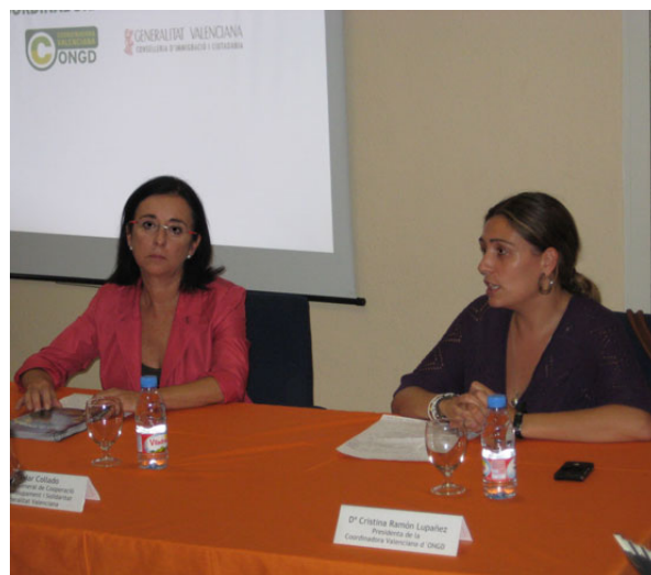
Presentación pública actividades CVONGD con Pilar Collado, Directora General de Cooperación 7 octubre 2009. CVONGD

Por último, reseñar que a finales de julio presentamos un propuesta de renovación para el año 2010 del convenio de colaboración por el mismo importe económico (80.000 euros); finalmente en la Ley de Presupuestos de la Generalitat Valenciana para 2010 aprobada, viene reflejado este Convenio pero con un importe menor (60.000 euros).