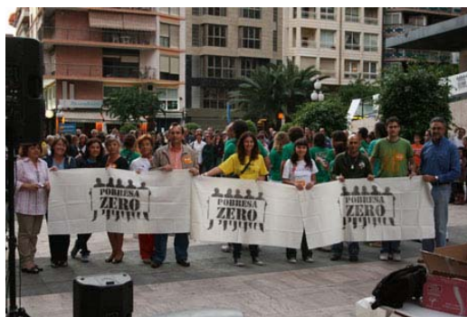
Concentración en Alicante el 17 de octubre. Semana contra la Pobreza 2009. UT Alicante.

En ALICANTE, en el Club Información se presentó el Pacto Valenciano contra la Pobreza, acto que contó con presencia de todos los partidos y grupos políticos firmantes del Pacto (PSPV-PSOE, Compromís pel País Valencià y Esquerra Unida PV), a excepción del Partido Popular, al que asistieron 80 personas.