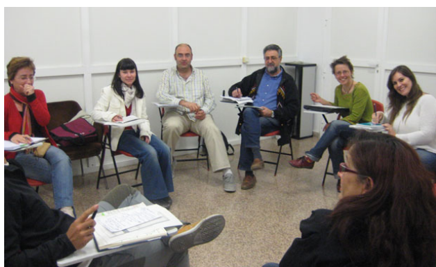
Reunión UT Alicante, 25 de marzo 2009. FUNDAR.

En Alicante ha aumentado la participación de las ONGD con nuevas incorporaciones en las reuniones y actividades con 30 personas de 21 ONGD. En marzo cuatro organizaciones, Caritas Diocesana Orihuela Alicante, Intermón Oxfam, Fundació Pau i Solidaritat y Solidaridad Internacional, asumieron de manera colegiada las funciones de coordinación hasta el año 2010.