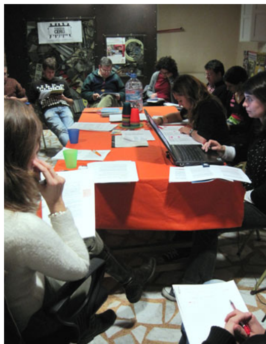
Reunión GT Políticas 24 de noviembre 2009. CVONGD

Asimismo el grupo trabajó en el texto, reuniones y firma del Pacto Valenciano contra la Pobreza, redactó el manifiesto de la Campaña Pobreza Cero y la propuesta de proceso para los pactos locales contra la pobreza. Todos estos documentos de propuestas y las acciones quedan