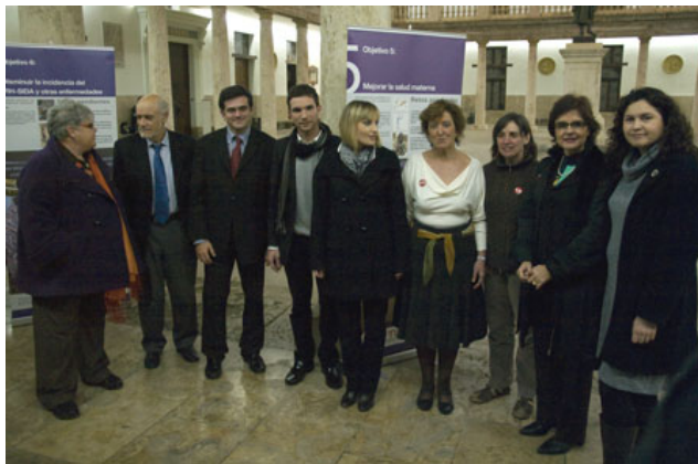
Presentación pública con los partidos políticos de la propuesta de Pacto Valenciano contra la pobreza en La Nau 25 de febrero 2009.

En el año 2009 se desarrolló una estrategia con todos los grupos y partidos con representación en Les Corts para lograr la firma del Pacto Valenciano contra la Pobreza. El proceso se inició a partir de la presentación pública de la propuesta del texto de la CVONGD y Plataforma Pobreza Cero, que se celebró el día 25 de febrero y donde los representantes de todos los grupos políticos expresaron su posicionamiento. Para consensuar el texto definitivo se mantuvieron