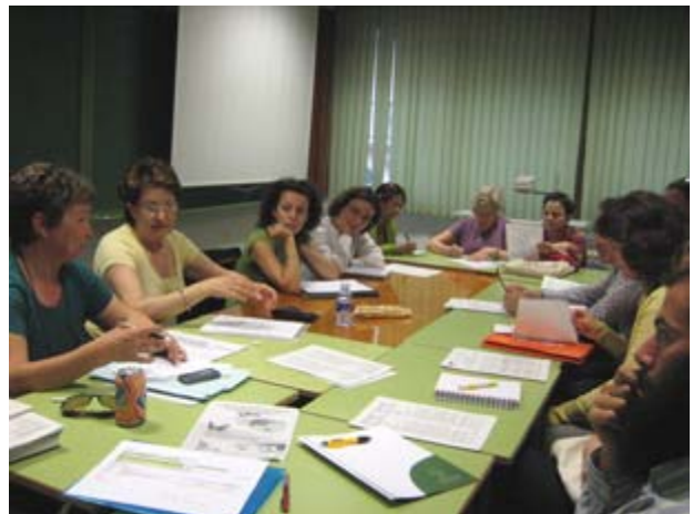
Reunión UT Castellón 19 de mayo 2009. Edificio Hucha Bancaja.

El número de organizaciones que han participado en las actividades llevadas a cabo por la Unidad Territorial en Castellón aumentó considerablemente. Uno de los motivos es la incorporación de nuevas ONGD en la CVONGD. Así pues de 22 organizaciones presentes en la provincia, 18 han participado, aunque en su mayoría de manera irregular, en las actividades llevadas a cabo: Acción contra el Hambre, Acsud Las Segovias, Amigos del Perú, Assamblea de Cooperació per la Pau, Ajuda Directa Safané,