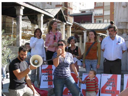
Concentración, Campaña Pobreza Cero, Castellón, 17 de octubre 2009. UT Castellón.