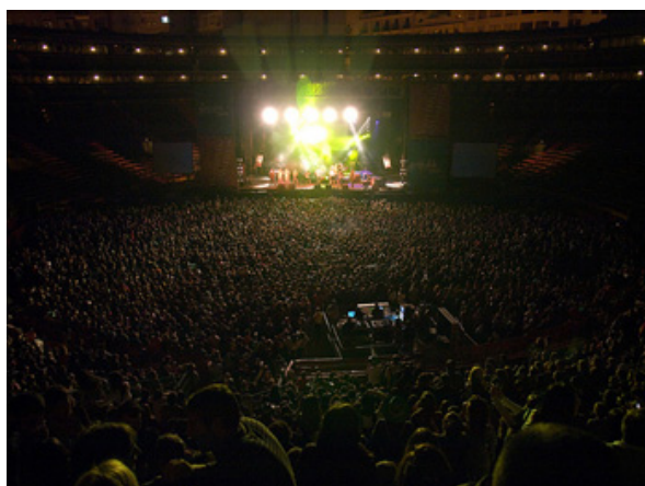
CONCERT DE BENVINGUDA A LA UNIVERSITAT DE VALENCIA con MACACO y SVATERS, 22 de octubre. Plaça de Bous de València. Imagen en Acción.