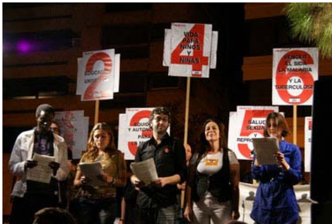
Lectura final del manifiesto con actor y actrices de la serie valenciana L'Alqueria Blanca, la presidenta de la CVONGD y el representante de colectivos de inmigrantes. 17 de octubre de 2009. Imagen en acción

Por último, en el Concert de Benvinguda de la Universitat de València, el día 22 de octubre, se recogieron 300 adhesiones a la campaña en las mesa de información que se colocaron. Además los beneficios de este concierto fueron destinados a las actividades de la Campaña Pobreza Cero.