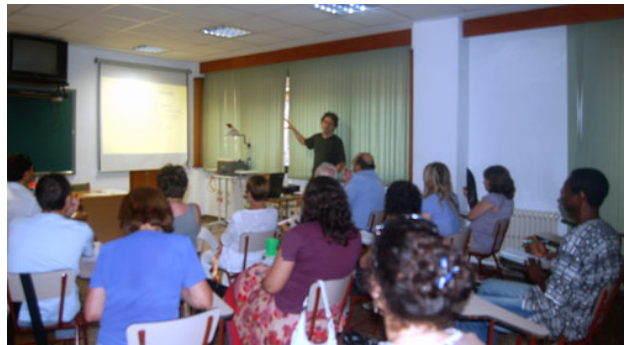
Formación Interna Instrumentos, legislación y marco general de la cooperación al desarrollo en Castellón. 30 de junio de 2009. CVONGD.