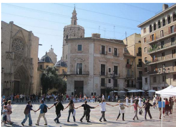
REBELARTE - Acción del 3 de octubre, Semana contra la Pobreza 2009. Plataforma Pobreza Cero.

La Plataforma ha mantenido cuatro grupos de trabajo (22 reuniones), siete reuniones de coordinación, dos encuentros de voluntarios para la Semana contra la Pobreza y un encuentro de entidades y plataformas locales de la Campaña, que se celebró en junio en Algemesí. Además participamos en el Encuentro nacional de Plataformas de Pobreza Cero celebrado en Madrid en mayo. De entre todos los actos en los que se ha participado hay que destacar el Concert de Benvinguda a la Universitat de València que supuso difusión y la recaudación de 9.274 euros para la Campaña, la participación en la Feria de Interculturalidad de Alzira en mayo y las actividades de la Semana contra la Pobreza que este año han movilizado a más de 30.000 personas de 22 localidades en la Comunidad Valenciana, de las cuales 20 organizaron concentraciones o manifestaciones en la calle, destacando la de Valencia en la que participaron unas 10.000 personas. Desde el área de formación por segundo año consecutivo impartimos un curso sobre los Objetivos de Desarrollo del Milenio en la Nau dels Estudiants y participamos en el Festival de Jazz de Alcablas, donde se presentó el proceso a seguir para la implantación de los pactos locales contra la pobreza.