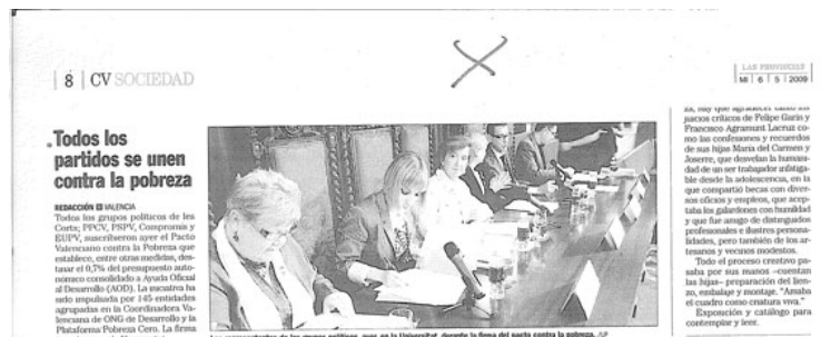
Noticias aparecidas en el Diario EL PAÍS y Las Provincias sobre la firma del Pacto Valenciano contra la pobreza.