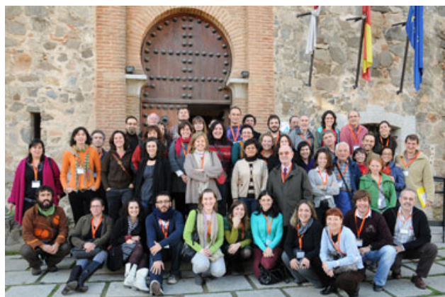
Encuentro de Autonómicas de Toledo, del 27 al 29 de noviembre 2009. Coordinadora de ONGD de España.

La CVONGD ha mantenido el contacto fluido con la Coordinadora de ONGD de España a través de la participación en la totalidad de las reuniones del grupo de Coordinadoras Autonómicas, que se celebraron con frecuencia bimensual, y desarrollando el taller sobre financiación de las coordinadoras autonómicas en el encuentro anual del grupo, que este año se celebró en Toledo en noviembre.