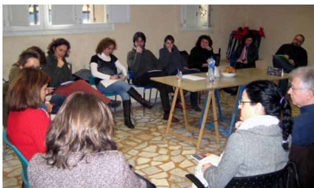
Reunión GT Educación para el desarrollo y sensibilización. 27 de febrero 2009. CVONGD

Para ello se crearon dos espacios de difusión y divulgación sobre el trabajo de las ONGD miembro. Una es la Web de la CVONGD, donde se trabajó un área específica con la Guía de materiales didácticos/educativos y materiales de sensibilización de las ONGD que integran la CVONGD, donde incluimos la herramienta elaborada por el grupo (el Mapa de Peters), y otra, es el centro de consulta de estos materiales disponibles en la CVONGD.