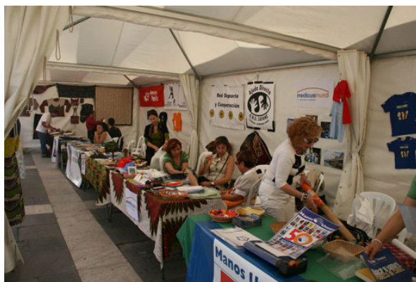
Día de la Cooperación Internacional. Castelló, 30 de mayo 2009. CVONGD.