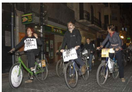
Bicicletada, Campaña Pobreza Cero, Castellón, 16 de octubre 2009. UT Castellón.

En CASTELLÓN los compañeros y compañeras de la UT Castellón organizaron actividades de sensibilización como mesas de información en la Universitat Jaume I y en el centro de Castellón, así como una Bicicletada el día 16 de octubre, en colaboración con Castelló en Bici.