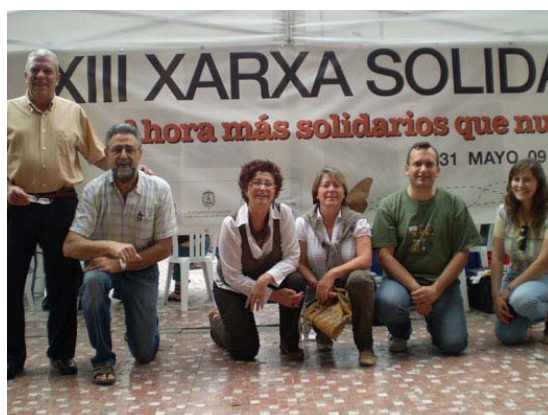
XIII Xarxa Solidaria, Alicante, 31 de mayo 2009.